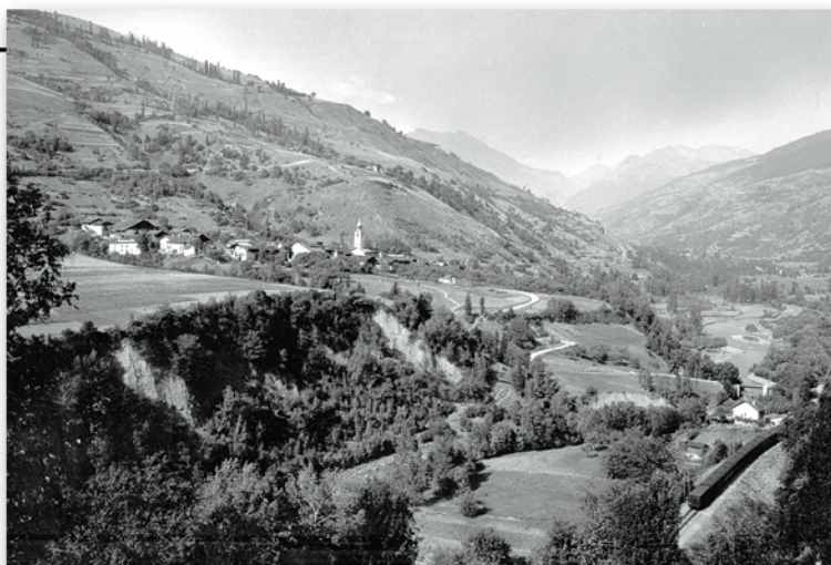
▲ Bellentre dans les années 1970.

La Tarentaise constitue une des six provinces de la Savoie et correspond à la vallée de l'Isère allant de sa source jusqu'à Albertville. Il s'agit d'une vallée glaciaire, assez étroite à certains endroits, bordée au sud par la Vanoise et au nord par les massifs du Beaufortin et du Mont-Blanc. La Tarentaise est frontalière du Val d'Aoste en Italie. Les