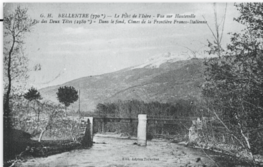
▲ Pont en fer sur l'Isère, début du 20 ème siècle.

Le territoire de Bellentre s'étend sur les deux versants de la vallée.