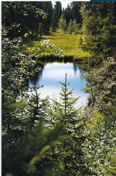
▲ Le lac Noir et la tourbière. Les eaux sont sombres car très chargées en matière végétale en décomposition.

Au Revers, la commune s'élève jusqu'à 3 035 m sous le glacier de Bellecôte. Elle possède des sommets importants comme la Roche de Mio (2 739 m) et la pointe de Friolin (2 678 m), ainsi que deux glaciers, situés à plus de 3 000 m d'altitude, celui de Bellecôte et celui de la Chiaupe (même s'ils sont situés sur le territoire de Champagny-en-Vanoise, voir p 25). Sur le territoire communal se trouvent également quelques lacs d'altitude : le lac du Carroley (2 186 m), le lac de Friolin (2 540 m) et le lac Noir (vers 1 700 m). Ce dernier plan d'eau est entouré d'une tourbière à sphaignes qui constitue une curiosité naturelle rare en Tarentaise. Comme beaucoup de lacs d'altitude, le lac Noir résulte d'un dépôt morainique abandonné par un glacier et formant une dépression qui, remplie par les eaux de pluie et de la fonte des neiges, s'est transformée en lac. Les sphaignes sont un genre de mousse pouvant de retenir 20 fois leur poids en eau. Ces plantes à croissance continue grandissent par leur extrémité émergée et meurent par leur base. Leurs débris se décomposent peu dans ce milieu humide, acide et privé d'oxygène. La matière organique ainsi obtenue, va se tasser, se charger en carbone et se transformer lentement (à raison de 6 cm par siècle) en tourbe. La tourbière du lac Noir a commencé à se constituer il y a 4 000 ans.