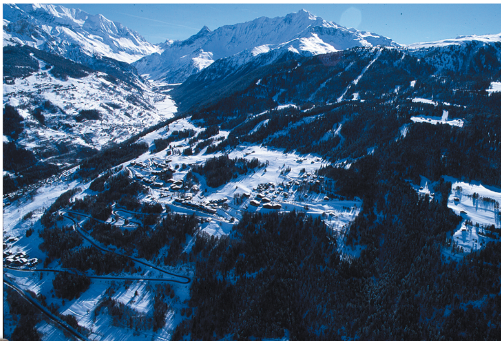
▲ Vue aérienne sur les stations de Montchavin (à gauche) et Les Coches (au centre). À l'arrière-plan, la vallée de Peisey-Nancroix et le sommet de Bellecôte.

Cette rivière, de plus de 286 km de long, prend sa source au glacier des Sources de l'Isère, sous la Grande Aiguille Rousse, près du col de la Vache sur la commune de Val-d'Isère en Savoie. Après avoir traversé les départements de la Savoie, de l'Isère et de la Drôme, elle se jette dans le Rhône au nord de Valence. Autrefois, l'Isère représentait une véritable séparation pour la communauté de Bellentre. Il n'était pas toujours facile pour les habitants du Revers de rejoindre le chef-lieu, en particulier pour assister aux offices religieux, en hiver ou lors de fortes pluies... Les crues de l'Isère ont causé quelques dégâts, comme en 1764 où le pont a été emporté (il sera reconstruit par