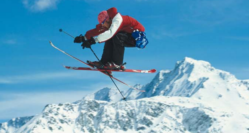
▲ Avec ses deux villages stations, Montchavin et Les Coches, Bellentre fait partie de l'immense domaine skiable Paradiski . À l'arrière-plan, le glacier de Bellecôte.

largement en rive gauche de l'Isère jusqu'à 3 035 m au pied du glacier de Bellecôte. Ce vaste territoire, où s'est développée la station de ski de Montchavin-Les Coches, est appelé le Revers de Bellentre.