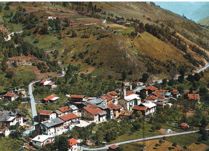
◀ Bellentre dans les années 1970. La RN 90 traversait le chef-lieu.

L'essor du tourisme et le développement rapide des stations de sports d'hiver après la Seconde Guerre Mondiale, ont redonné un nouvel élan à de nombreux villages de Tarentaise. Depuis le début, Bellentre fait partie de l'aventure de La Plagne, initiée en 1961. La création, sur son territoire, de deux stations de ski, Montchavin en 1973 et Les Coches en 1980 a redynamisé toute l'activité économique de la commune. Grâce à l'implantation sur la station des Coches d'une des deux gares du Vanoise Express, Bellentre se trouve au milieu de l'immense domaine skiable Paradiski qui réunit La Plagne et Les Arcs.